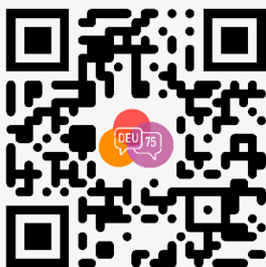
ГБОУ СОШ №75 с углубленным изучением немецкого языка