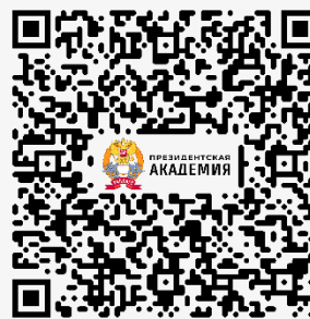
Российская академия народного хозяйства и государственной службы при Президенте Российской Федерации