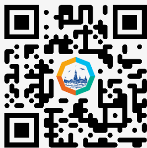
Петербургский международный образовательный форум